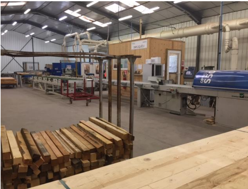
L'atelier (tout mécanisé)

France bois imprégnés propose aux vignerons et arboriculteurs, un piquet en bois imprégné selon les critères requis pour les poteaux de ligne, assortis d'une assurance dégâts collatéraux de 15 ans élargie aux cultures.